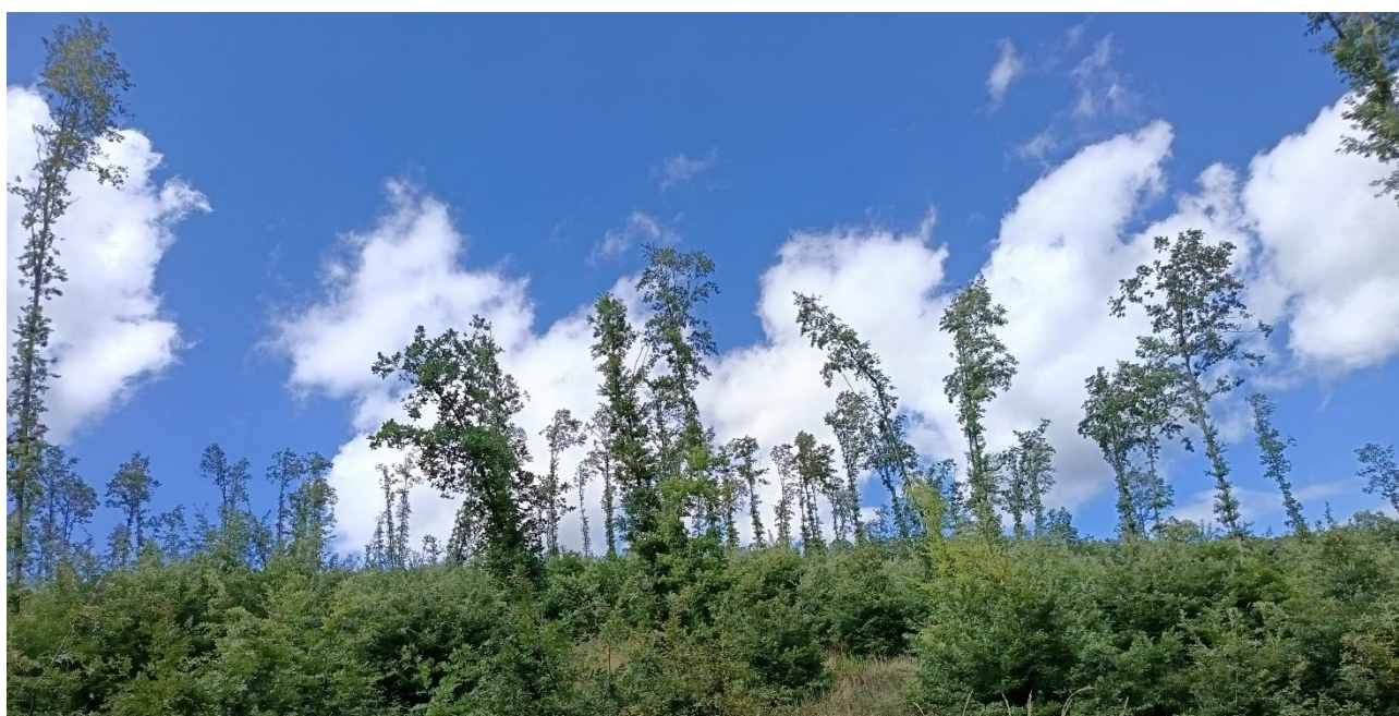
Figura 2: Bosco di 5 anni: ricrescita del novellame sotto alberi lasciati in piedi