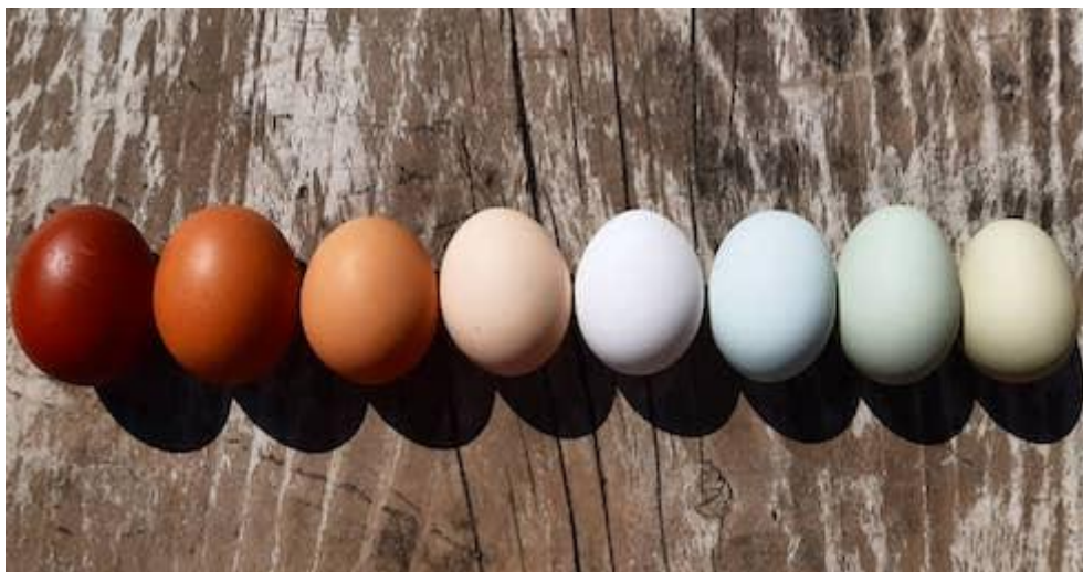
Figura 3: Ogni gallina produce uova dal guscio di colore diverso

La gestione di questi mirco allevamenti di bosco, deve essere affiancata ad un’adeguata struttura di governance. In questo caso, si raccomanda di sviluppare reti di imprese per la gestione collettiva dei pollai mobili e per la gestione delle necessarie autorizzazioni sanitarie. I costi devono comprendere etichettatura, cure veterinarie, adempimenti ASL, marketing condiviso con il marchio ombrello “ Uova di Bosco ”, riducendo così i costi individuali e aumentando la capacità di mercato.